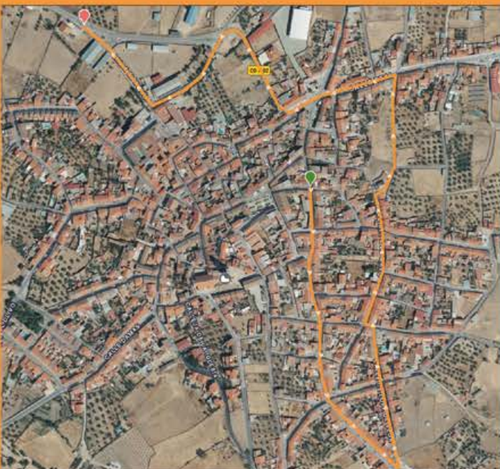
DÍA 8 IDA