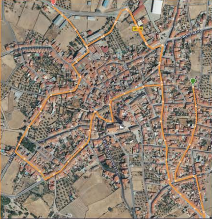
DÍA 7 IDA