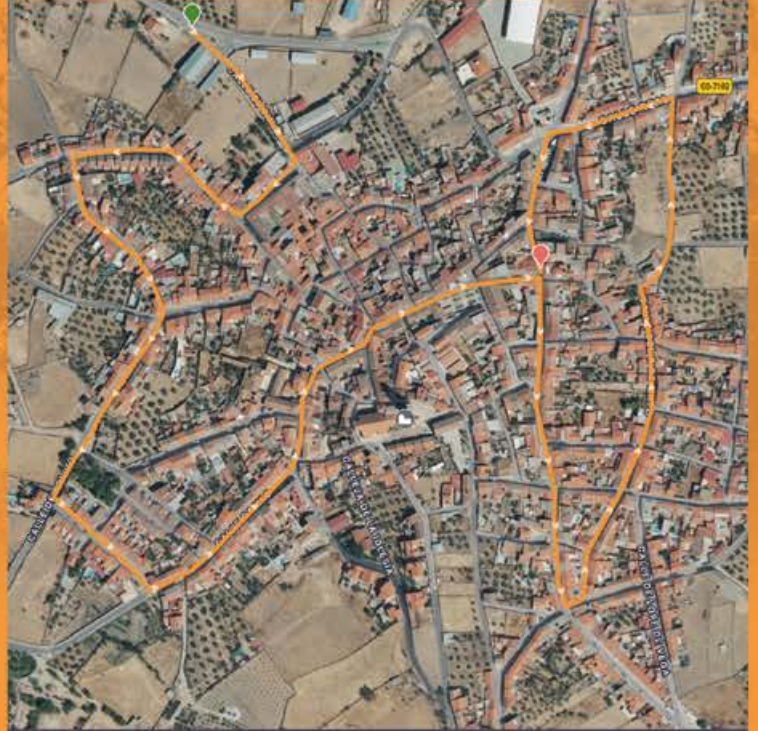
DÍA 7 VUELTA