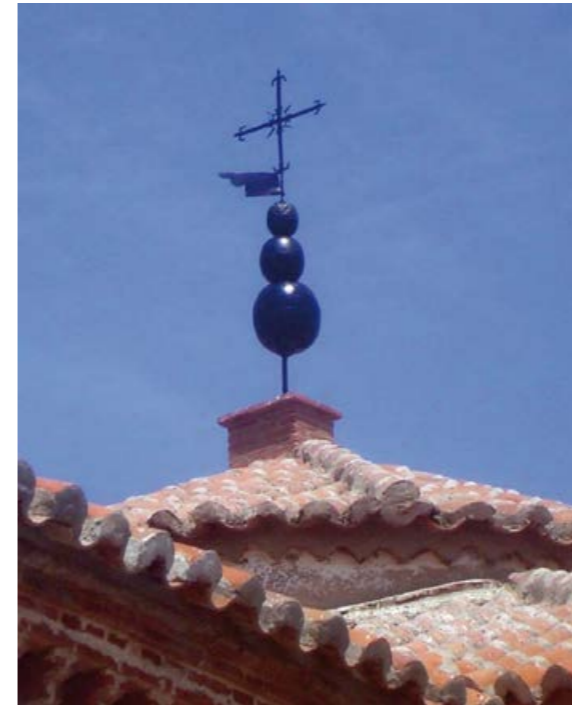
Yamur de Pedroche