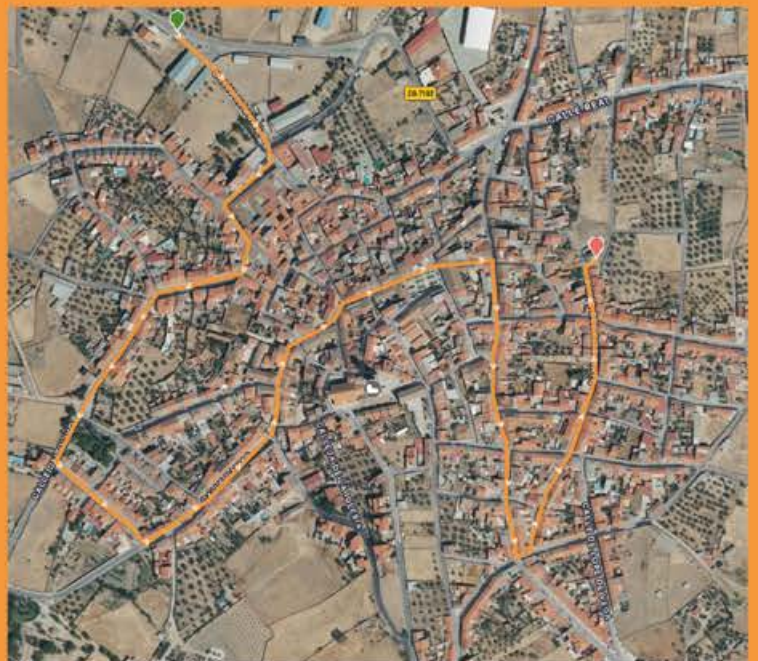
DÍA 8 VUELTA